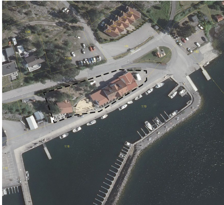
Bild 1: Flygfotografi som visar hamnen och byggnader på platsen. Planområdet markerat med svart streckad linje.