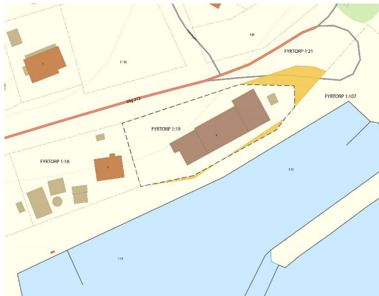
Bild 2: Kartbild som visar hamnen och byggnader på platsen. Nya området för fastigheten Fyrtorp 1:19 markerat med svart streckad linje. Områden aktuella för fastighetsreglering markerade med gult. Kartunderlag från Lantmäteriets fastighetskarta.

Ansökan om fastighetsreglering görs till Lantmäteriet.